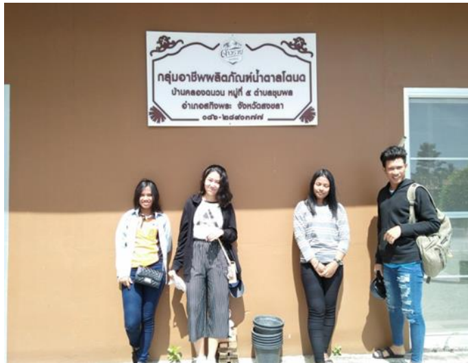
ภาพที่ 3 สัมภาษณ์สถานประกอบการผลิตน้ำตาลแว่น

เครื่องมือที่ใช้ในการวิจัย คือ แบบสัมภาษณ์สำหรับการเปรียบเทียบต้นทุนกระบวนการผลิตและการแปรรูปน้ำตาลแว่น จากน้ำตาลโตนด แบบสัมภาษณ์ใช้ศึกษาต้นทุน และกระบวนการผลิตน้ำตาลแว่น จากน้ำตาลโตนดของธุรกิจผู้ประกอบการน้ำตาลแว่น อำเภอสิงหนคร และกลุ่มอาชีพผลิตภัณฑน้ำตาลโตนด อำเภอสทิงพระ จังหวัดสงขลา ประกอบด้วย 15 ข้อคำถามปลายเปิด