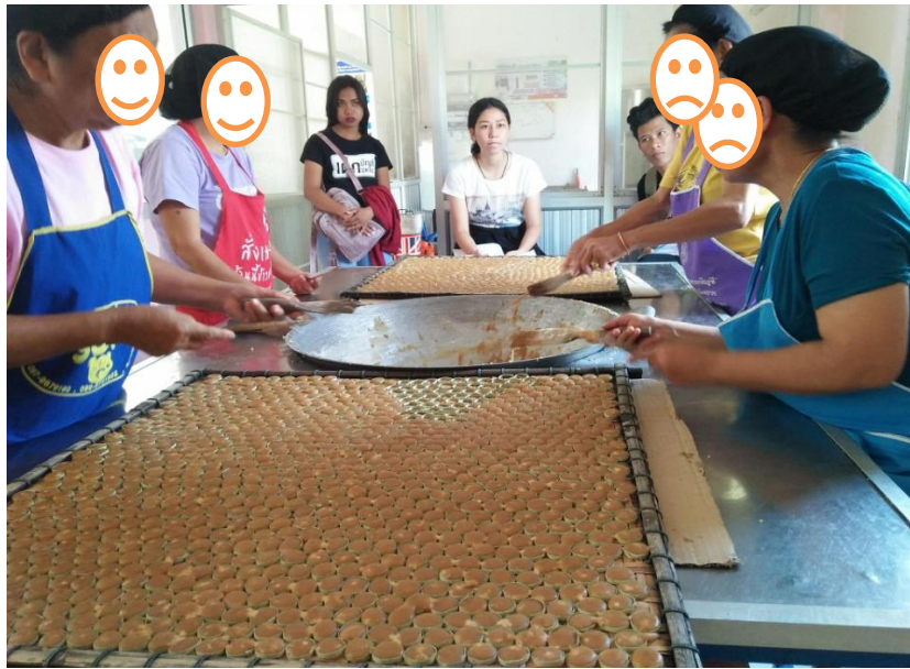
ภาพที่ 4 สอบถนอมต้นทุนผลิตน้ำตาลแว่น