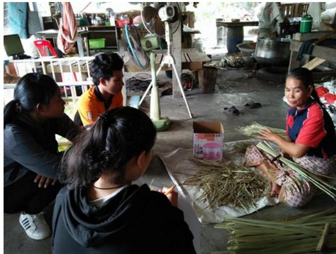
ภาพที่ 2 สัมภาษณ์ชาวบ้านเกี่ยวกับน้ำตาลแว่น

ประชากรผู้ที่สามารถตอบคำถามตามแบบสอบถามงานวิจัยนี้ได้ คือ ผู้ผลิตน้ำตาลแว่นในอำเภอสิงหนคร และอำเภอสทิงพระ จังหวัดสงขลา ส่วนประชากรที่สามารถให้ข้อมูลเชิงคุณภาพเบื้องต้นเติมเต็มการทบทวนวรรณกรรม คือ ผู้ซื้อทั้งภายในและภายนอกอำเภอสิงหนคร และอำเภอสทิงพระ จังหวัดสงขลา ผู้ประกอบการ และผู้บริโภค ซึ่งประกอบด้วย พ่อค้าคนกลาง และชาวบ้าน